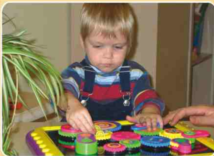
A Gyermekmentő Szolgálat terápiás rendelőjében

Van egy 50 négyzetméteres, nagy belmagasságú termünk, amelyet speciális hintaszerű eszközökkel szereltünk fel, itt a módszerben jártas terapeuta segítségével egyfajta mozgás-terápia – szaknyelven szenzo-motoros integrációs terápia – zajlik. Ennek a terápiának Ayres terápia a neve, és kifejezetten alkalmas figyelemzavarral küszködő és hiperaktív gyermekek terápiájára. Röviden úgy lehet megfogalmazni, hogy a központi idegrendszer a terápia során megtanulja és újra értékeli, azaz integrálja az őt érő információkat. Ez a koncepció a mozgásérzékelésre fektet hangsúlyt: a „nagymozgások” javulásával a finom-