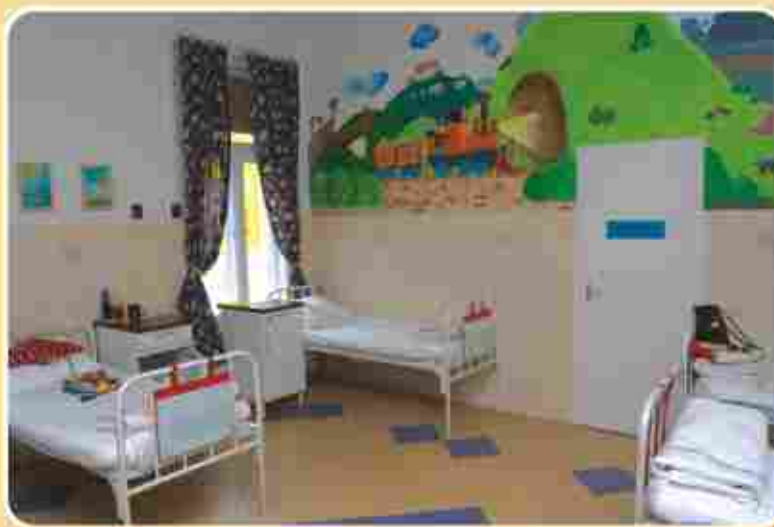
A baba-mama szoba