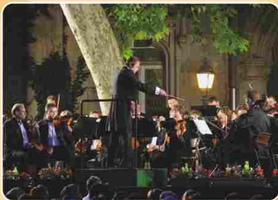
A Matáv Szimfonikus Zenekar a Vajdahunyad Várban