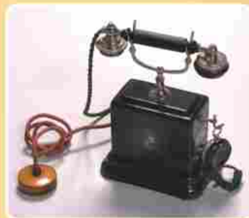
I. Ferenc József távközlő készüléke