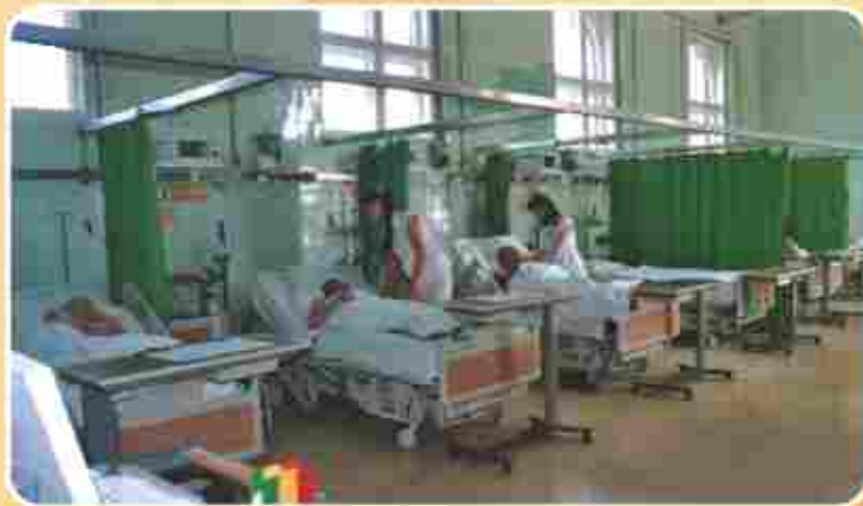
A koronária őrzőszoba

ellátva, az itt elhelyezett betegek pedig térítési díjat fizetnek az extra szolgáltatásért. A most lecserélendő betegőrző monitorokat is hasonló konstrukcióban, a Kórházzal közösen vásároltuk tíz évvel ezelőtt, és az őrző modern felszerelését, minden irányba