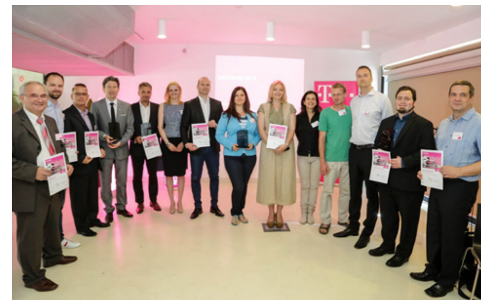
DELFIN Díjak átadása

Az Autonómia Alapítvány elsősorban roma integrációval, a civil társadalom megerősítésével és kirekesztett csoportok támogatásával foglalkozik. A Budapest Bike Maffia és a Heti Betevő a rászorulóknak nyújt étkezési lehetőséget; az előbbi szervezet kerékpárral szállítja ki az adományokat, míg a másik heti rendszerességgel éttermi minőségű ételt oszt. Környezetünkért és annak megóvásáért tesz intézkedéseket a Magyar Madártani és Természetvédelmi Egyesület (MME) , amely a madarak védelméért dolgozik országszerte, és a Magyar Természetvédők Szövetsége , mely szemléletformáló programokkal növeli a lakosság és a döntéshozók környezeti tudatosságát. A SUHAN! Alapítvány a mozgás örömét osztja meg sérült és fogyatékkal élő társainkkal.