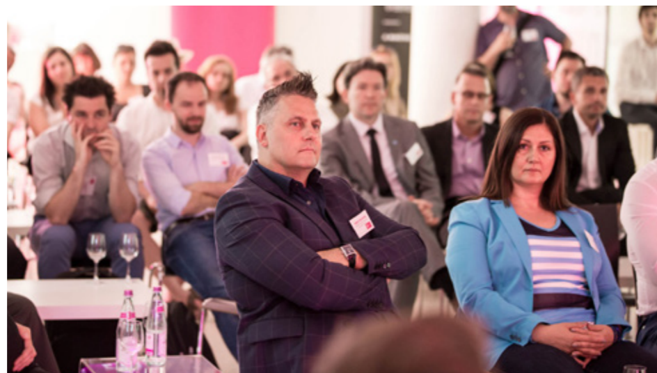
XVI. Fenntarthatósági Kerekasztal-beszélgetés

Általánosságban elmondható, hogy érdekelt feleink a közpolitikában való részvételt tartják legkevésbé fontosnak a vállalat fenntarthatósági tevékenységét illetően. A kapott visszajelzéseket a jelentés szerkezetét meghatározó lényegességi elemzésünk elkészítéséhez vettük figyelembe.