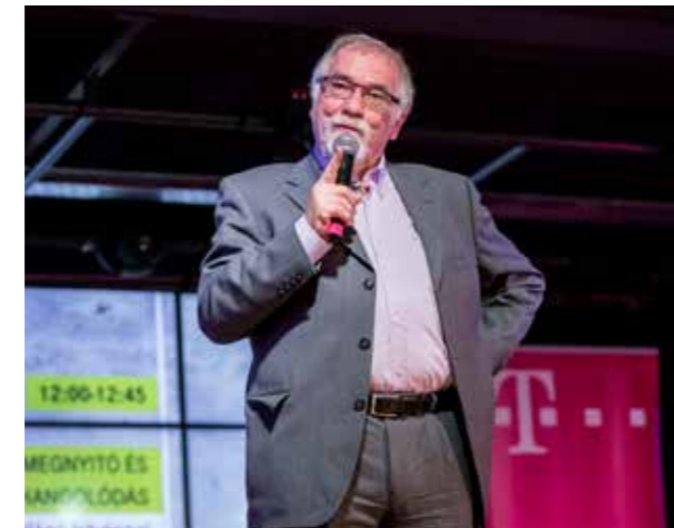
Vágó István inspirációs előadása a 9. Fenntarthatósági Napon

Szeptember 24-én kilencedik alkalommal került megrendezésre a Fenntarthatósági Nap (FN9). Az „Okosabb vagy, mint 5 éve?” jelmondat köré szerveződő rendezvényre rekordszámú, 5000 érdeklődő látogatott el. A programot ezúttal új helyszínen, az Akvárium Klubban Vágó István inspirációs előadása nyitotta meg. A kvíznagymester saját tapasztalatain keresztül mutatta meg, hogy mi is a különbség az okos, az intelligens, a művelt és a smart emberek között.