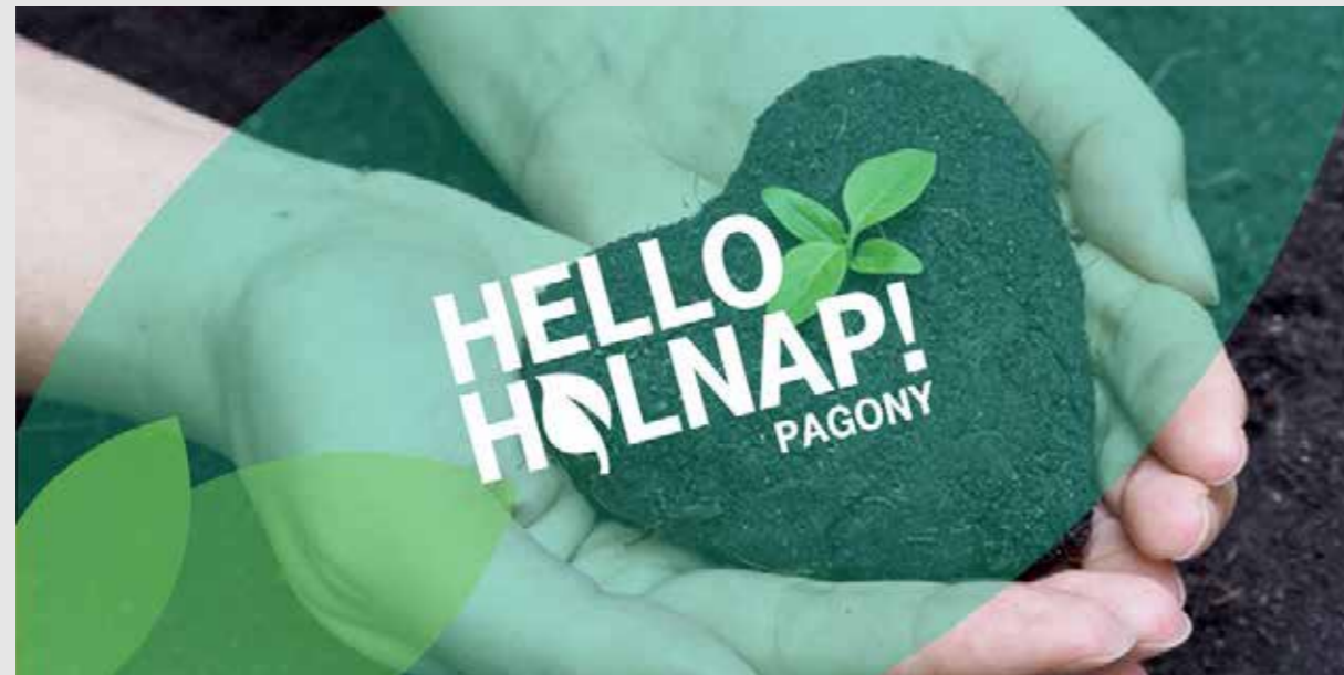
Eddig 571 fát ültettünk a hello holnap! pagony, virtuális erdőben.

Az Adni jó! sütiakcióban 2016-ban is több száz munkatársunk vett részt. 60 önkéntes munkatársunk szervezte meg az akciót összesen 15 telephelyünkön, a rendezvény során december 5-én, az önkéntesség világnapján 230 tálcányi finomság kelt el. Az akció eredményeként 1,7 millió forintot gyűjtöttünk az Autistic Art – Mosoly Otthon Alapítvány javára.