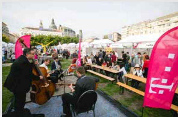
9. Fenntarthatósági nap

Kilencedik alkalommal rendeztük meg a Fenntarthatósági Napot , most is szeptember utolsó szombatján. A rekordszámú, 5000 fős látogatói tömeg ezúttal is számos kiállító, köztük civil szervezetek munkáját ismerhette meg.